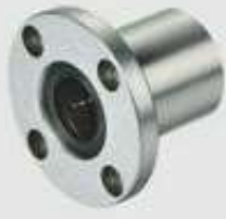
LMF 圆法兰型 CIRCULAR TYPE