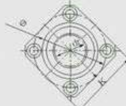
LMK 方法兰型 SQUARE TYPE