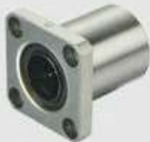
LMK 方法兰型 SQUARE TYPE